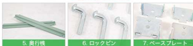
⑤ 奥行棧 (天地受け) ×4本 ⑥ ロックピン×16個 ⑦ ベースプレート×4個